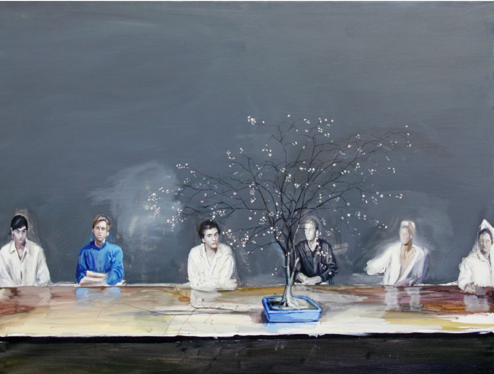
Verwandlung, 170 x 130 cm, Öl auf Leinwand, 2007