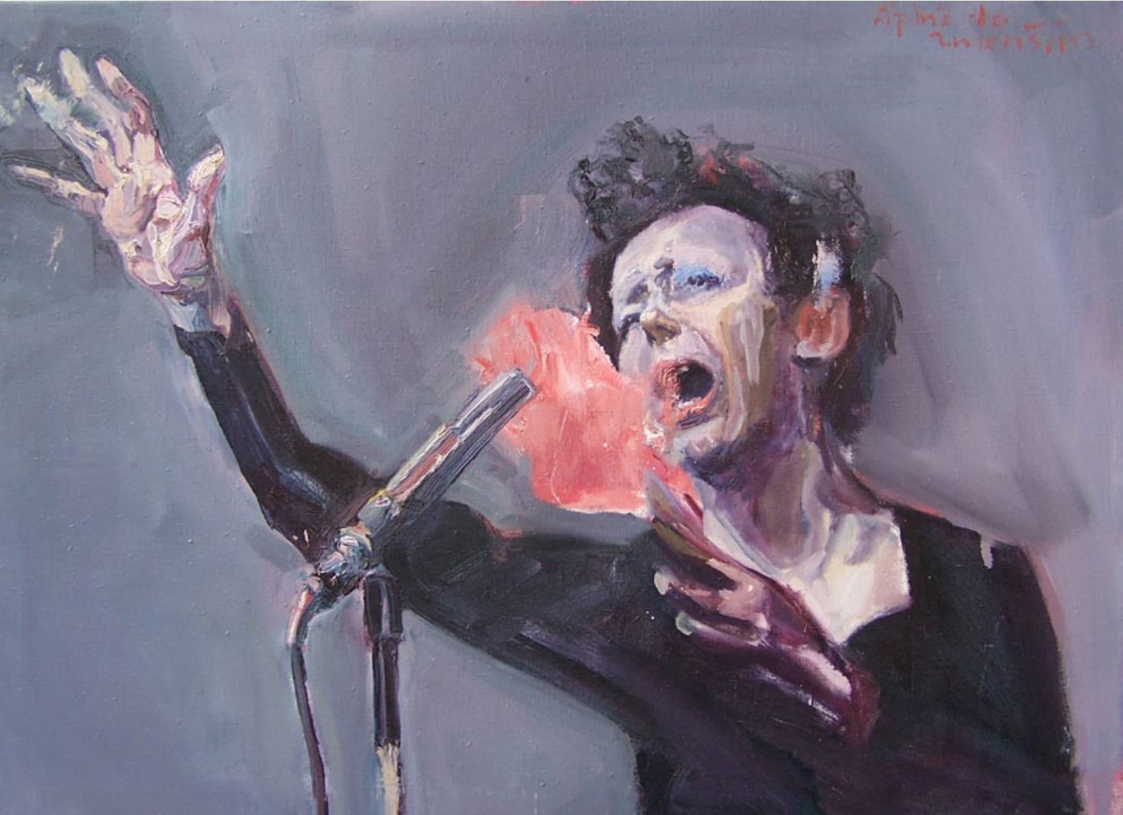
Piaf, 70 x 100 cm, Öl auf Leinwand, 2006