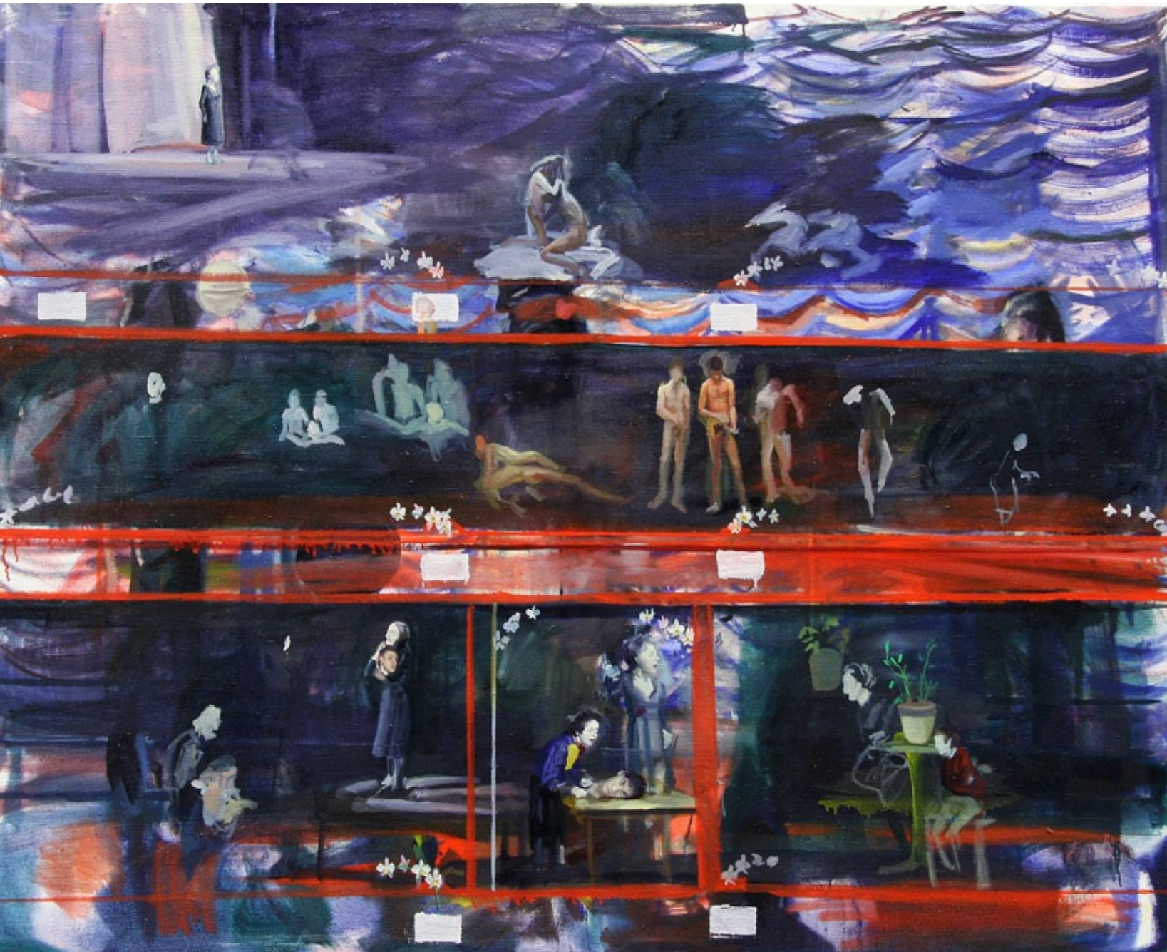
il Decameron, 170 x 135 cm, Öl auf Leinwand, 2009