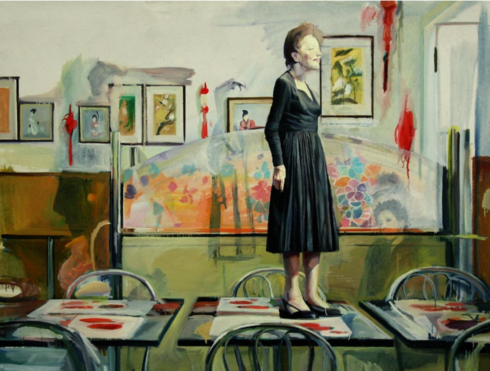
Asia Bistro, 190 x 145 cm, Öl auf Leinwand, 2009