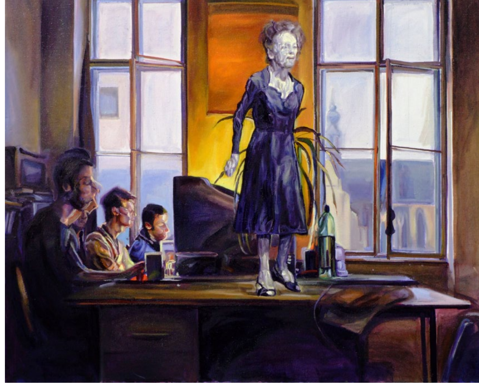
Studienzimmer, 160 x 140 cm, Öl auf Leinwand, 2007