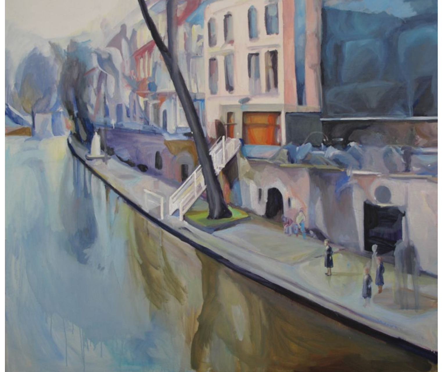
Utrecht, 140 x 125 cm, Öl auf Leinwand, 2010