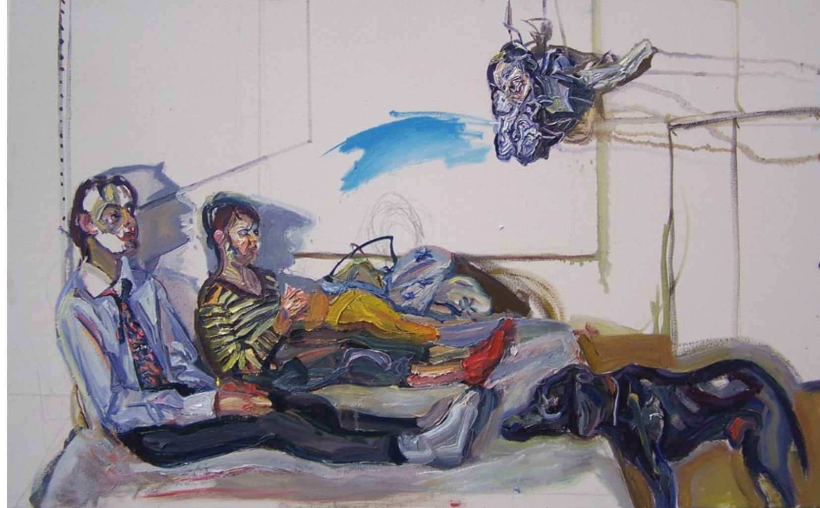
Hund am Bett, 60 x 100 cm, Öl auf Leinwand, 2007