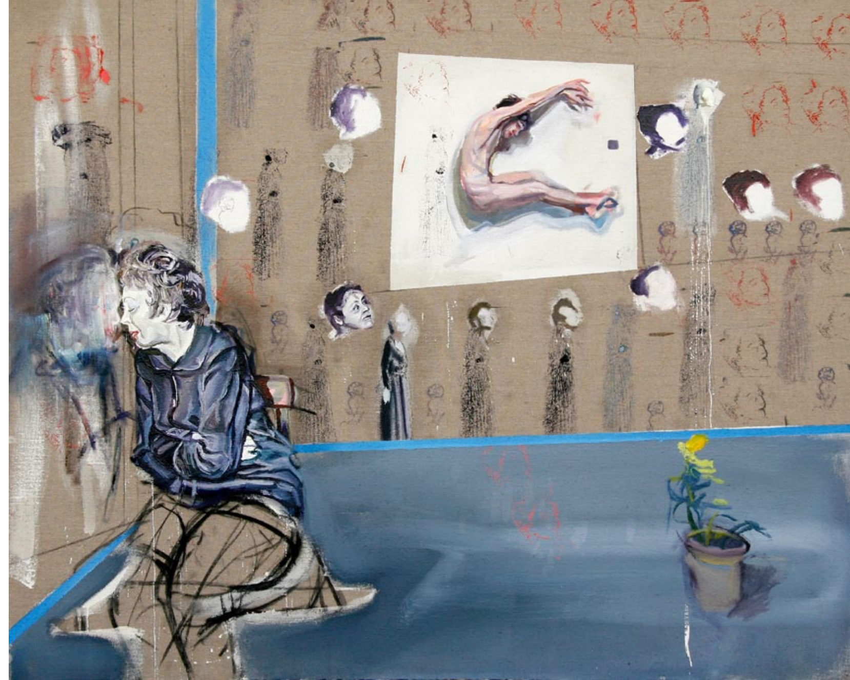
Am Fenster, 170 x 135 cm, Öl auf Leinwand, 2008