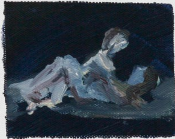
Rosenrot, Öl auf Leinwand, 30 x 30 cm, 2010