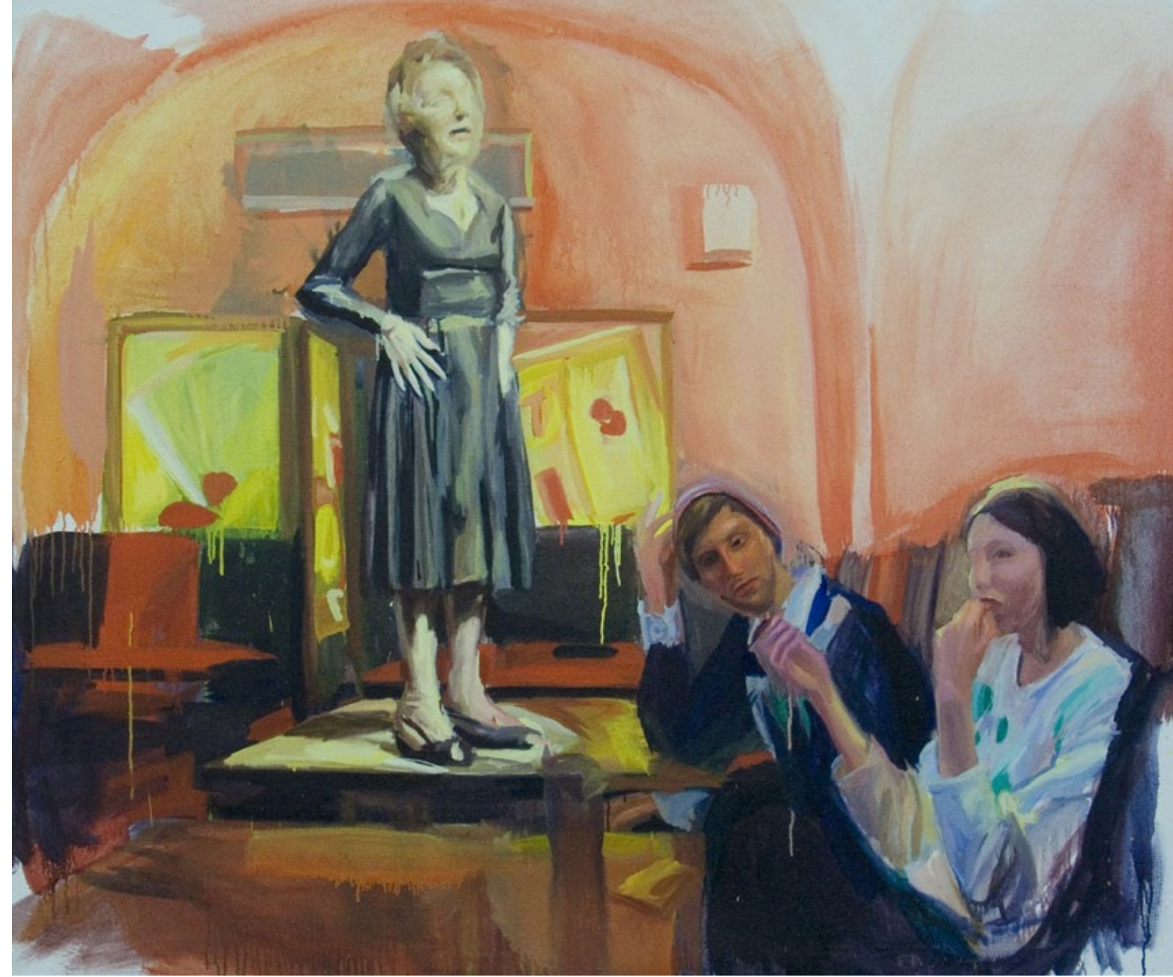
Non stop bar, 170 x 145 cm, Öl auf Leinwand, 2009