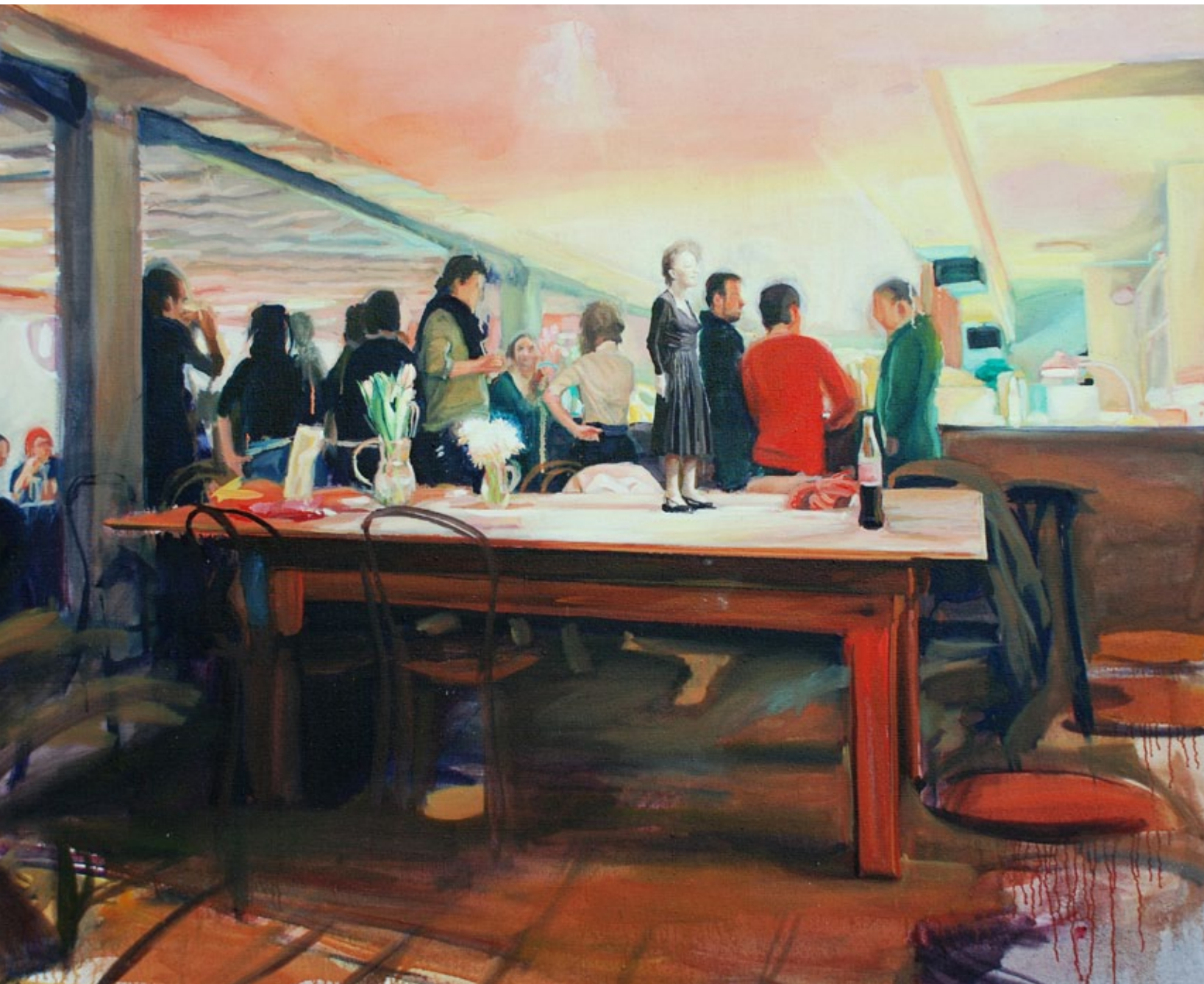
Auf dem Tisch, 160 x 130 cm, Öl auf Leinwand, 2009